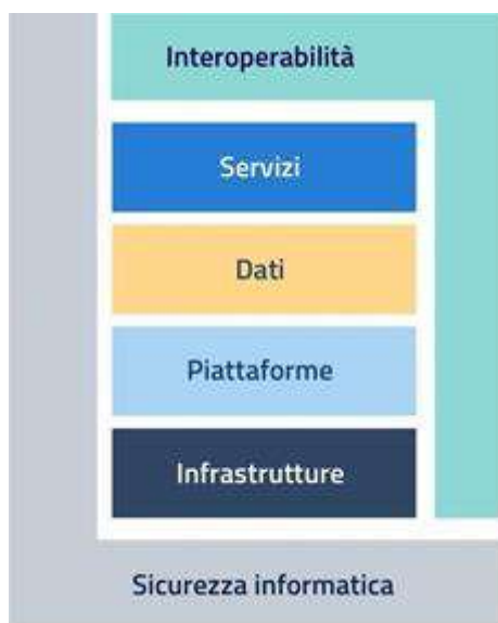
Figura 1 - Modello strategico di evoluzione del sistema informativo della Pubblica Amministrazione

L'aggiornamento 2022-2024 del Piano Triennale mantiene inalterata la struttura del documento consolidata nella scorsa edizione e fa riferimento al Modello strategico di evoluzione ICT della PA, che descrive in maniera funzionale la trasformazione digitale, attraverso: due livelli trasversali relativi a interoperabilità e sicurezza informatica e, quattro livelli verticali per servizi, dati, piattaforme ed infrastrutture.